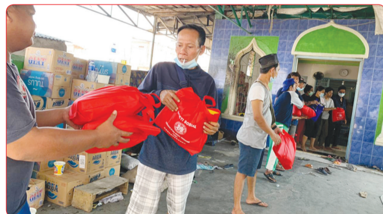
Warga bergotong royong menurunkan bantuan kemanusiaan yang di bawa perwakilan YEMI.