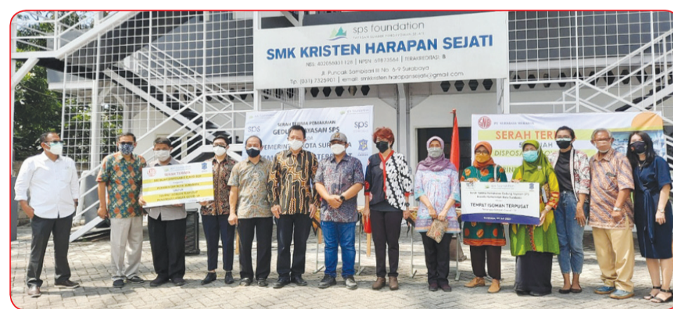
Prosesi serah terima gedung.

PT Surabaya Mekabox memproduksi disposable Covid Bed yakni tempat tidur dari karton yang dapat dibongkar pasang. Kekuatannya teruji mampu menahan beban hingga 180 kg.