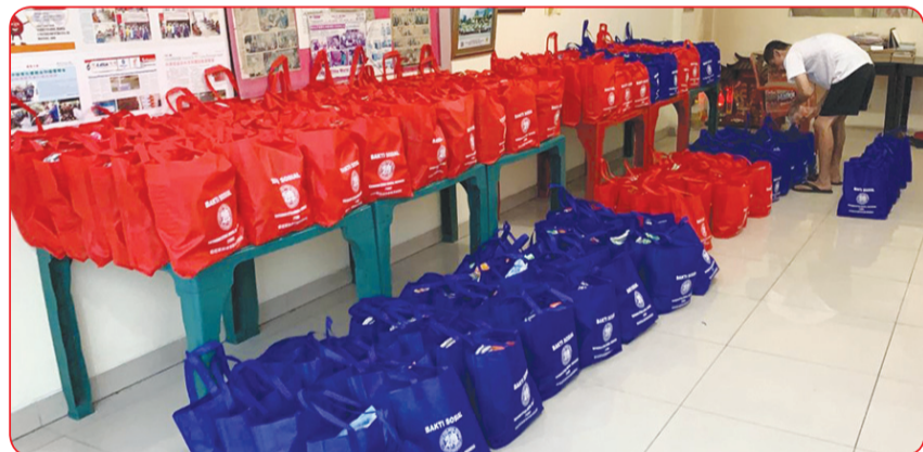
Paket bantuan kemanusiaan YEMI untuk warga korban kebakaran.