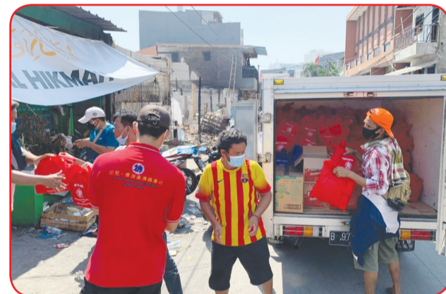
Warga bergotong royong menurunkan bantuan kemanusiaan yang di bawa perwakilan YEMI.

YEMI yang berkantor di Jalan Pluit Karang Indah VIII (Blok Q8) No.45A Pluit, Jakarta Utara memiliki program bakti sosial, antara lain penyelenggaraan vaksinasi, pemberian bantuan kepada korban bencana dan rutin gelar donor darah. • kris