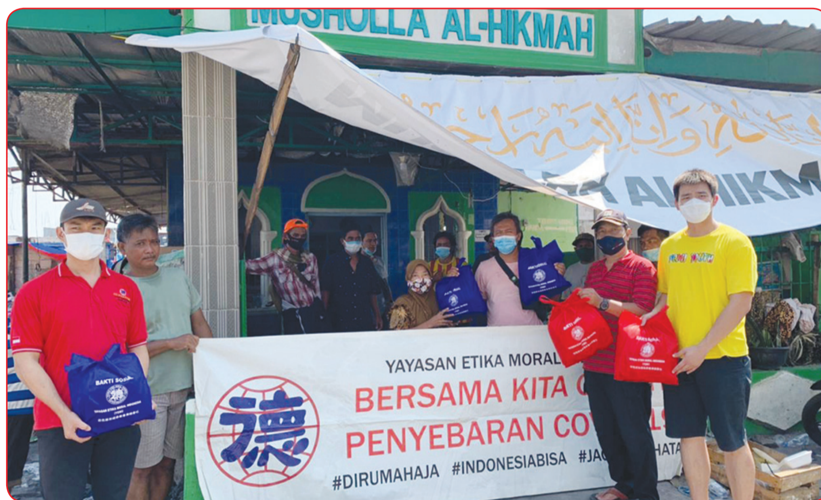
Perwakilan YEMI saat menyerahkan bantuan kemanusiaan bagi warga korban kebakaran.

Bantuan kemanusiaan digalang dari para donatur, dimana bantuan yang diberikan kepada warga korban kebakaran berupa 200 pcs selimut, 200 pcs handuk, 200 pcs sikat gigi Formula, 200 pcs pasta gigi Pepsodent @75 gram, 200 pcs sabun mandi Lifebuoy, 200 botol MKP.Lang 330 mili, 200 dus Masker, 200 pcs biskuit Roma Malkis kotak, 200 pcs Susu Ultra 250 mili dan 200 kotak Vitamin C 1000.