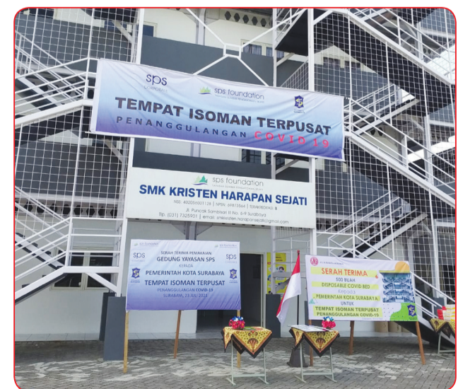
Gedung tempat Isoman terpusat.