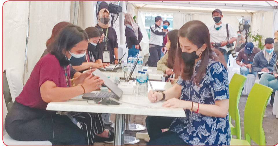
Angela Tanoesoedibjo saat mendaftar vaksin.

JAKARTA (IM) - Kemenparekraf (Kementerian Pariwisata dan Ekonomi Kreatif) bersama MNC Peduli, bersama Doktera Clinic, Traveloka, Mister Aladin, dan GBI Glow Fellowship Center menghadirkan Sentra Vaksinasi CO-