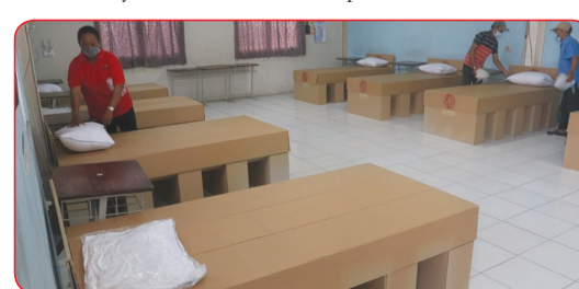
Ruang dalam gedung dilengkapi tempat tidur dari karton.