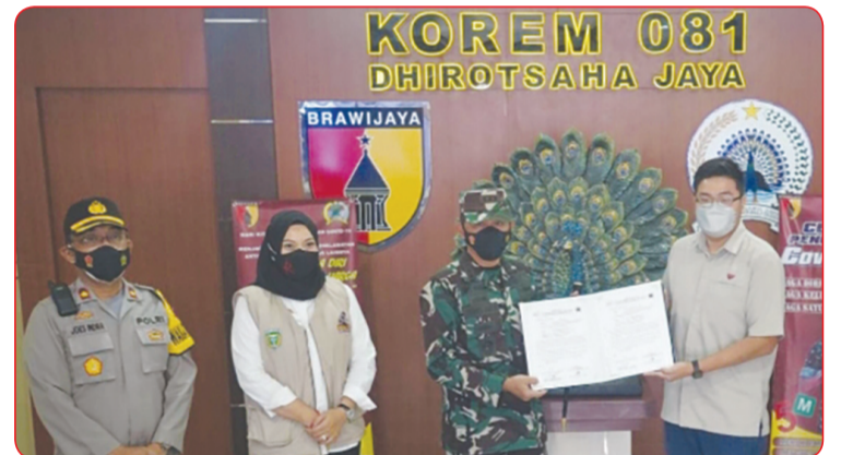
Yayasan Wings Peduli menyerahkan bantuan melalui Korem 081.

SURABAYA (IM) - Pandemi Covid-19 belum juga usai. Hal ini berdampak di segala sektor yang dirasakan masyarakat. Pemerintah memberlakukan PPKM Darurat untuk menekan kasus lonjakan Covid-19.